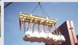
Frame com Garra para Fardos.

Nota: As especificações técnicas e ilustrações estão sujeitas a alterações sem prévio aviso.