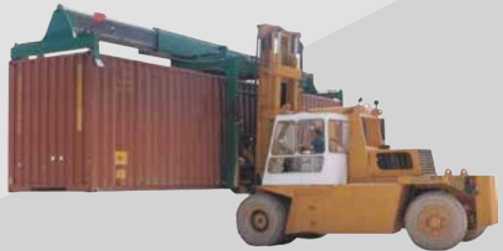
SIS - Spreader Integrado