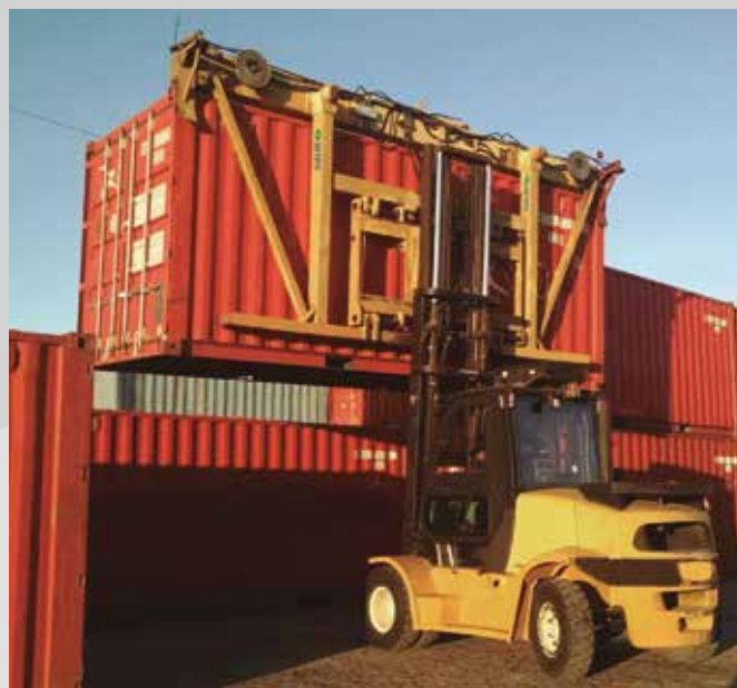
TSS - Top Spreader - 1 função hidráulica