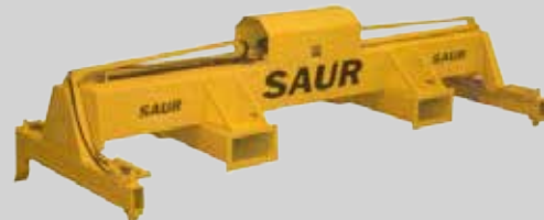
SES - Spreader de Encaixe nos Garfos