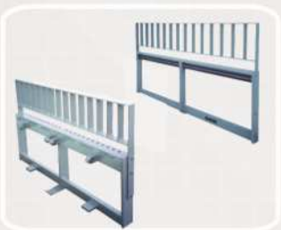
Engate tipo ISO Integrado