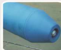
Nylon Plus Blue até 200°C