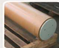
Celeron até 120°C