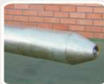
Bronze acima de 200°C

Revestimentos específicos, no tarugo e corpo, para cargas delicadas.